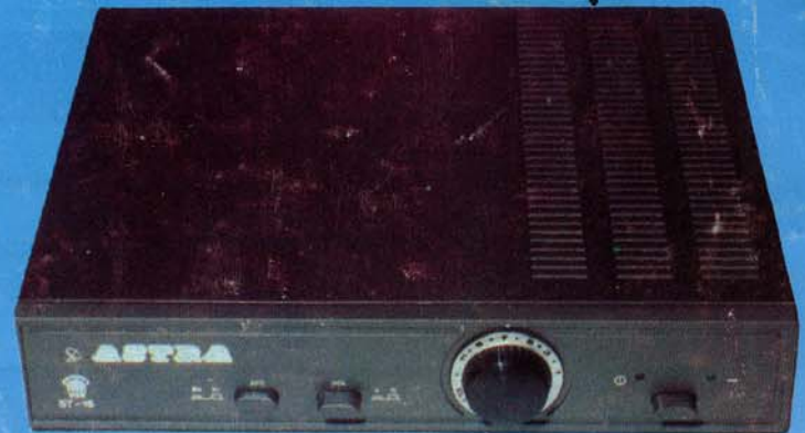
ST-16 beltéri vevő