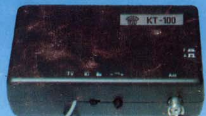
KT 100 kábeltvé konverter